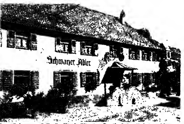
Der „Schwarze Adler“ gilt als ältester Gasthof des Kaiserstuhls und ist zugleich ein traditionsreiches Weingut

Und für die Heimfahrt empfiehlt sich's immer, die eine oder andere Kiste aus dem Keller ins Auto zu packen.